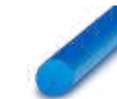
WP5096 WP5096A WP5096B