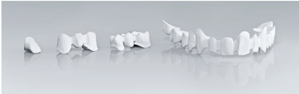
Ampla gama de indicações

Dente unitário até estruturas de pontes de múltiplos elementos