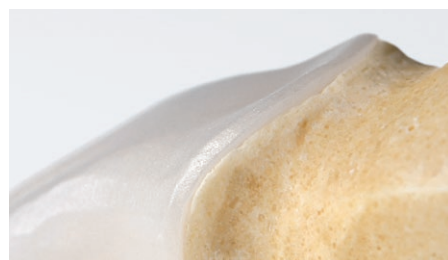
Muito boa precisão de adaptação