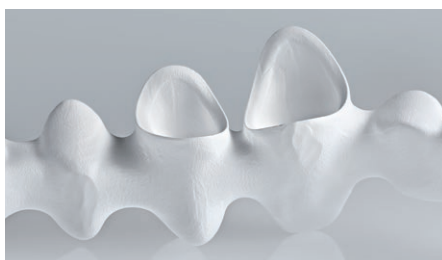
Excelentes resultados de fresagem

Excelentes propriedades de fresagem, precisão de adaptação e alta estabilidade da borda.