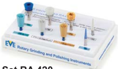
Set RA 420 Seite / Page: 52